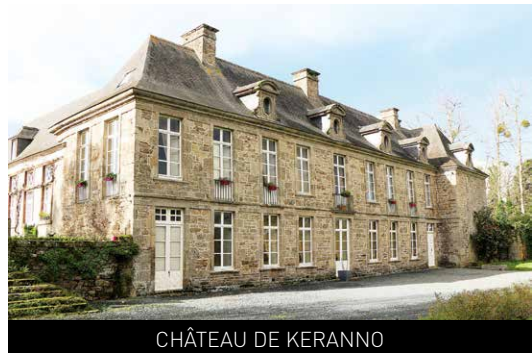
CHÂTEAU DE KERANNO