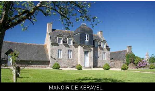
MANOIR DE KRAVEL