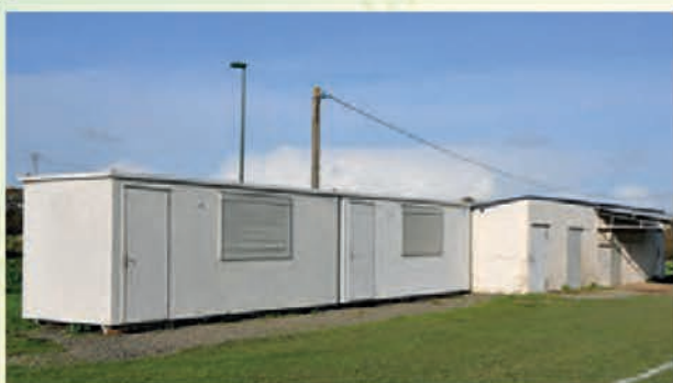
• Les installations actuelles.

Le plateau sportif du Rucæër, d'une superficie de 27 801 m 2 se compose de deux terrains homologués pour la pratique du football et de terrains d'entraînement. En l'état actuel, les bâtiments existants se composent d'un vestiaire de 50 m 2 construits en 1985 et de deux mobil homes installés en 2009. Ces locaux ne répondent plus aux normes d'hygiène et de sécurité en vigueur.