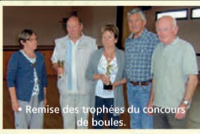
• Remise des trophées du concours de boules.

Le 27 juin , le club s'est réuni avant les vacances d'été. A cette occasion, un concours de boules a été disputé entre les adhérents. En soirée, après la remise des trophées aux vainqueurs, un buffet campagnard a été servi.