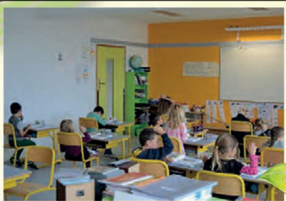
• Une nouvelle salle de classe.

Une fois de plus, nous avons pu compter sur leurs précieuses compétences pour mener à bien ce chantier, ainsi que parfaire l'aménagement des nouveaux locaux.