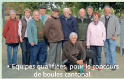
• Équipes qualifiées pour le concours de boules cantonal.

Le jeudi 30 mai , en préparation du concours cantonal de boules se déroulant à Ploumagoar, quatre équipes du club se sont qualifiées pour participer à ce championnat.