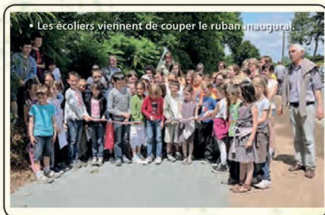
• Les écoliers viennent de couper le ruban inaugural.

Le maire a commencé par présenter le monument aux morts, puis l'ancienne mairie qui autrefois était aussi l'école, puis il a invité les participants à une visite de l'église Saint-Tugdual commentée par Loïc Frémont. Après un bref passage par le cimetière pour voir le monument funéraire de Louis Marie Gouyon de Coppel, comte de Munehorre, tout le monde s'est rendu au village de Kerez, berceau des potiers depuis le XVIII ème siècle dont l'activité s'est éteinte à la première guerre mondiale.