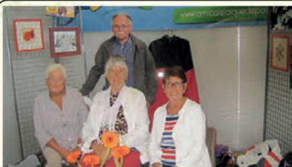
• Le stand au forum des associations.

L'amicale a participé au forum des associations à Ploumagoar le samedi 7 septembre. Les bénévoles présents sur le site n'ont pas chômé; ils ont été très sollicités par des demandes en tout genre ( activité, horaires, prix ), pour le plus grand bonheur du président.