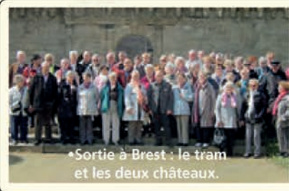
• Sortie à Brest : le tram et les deux châteaux.

Le 17 mai : sortie à Brest sur le thème : « Le tram et les deux châteaux ». Cette sortie s'est démarquée par sa grande originalité : une balade exceptionnelle et confortable en tram sur une dizaine de kilomètres, un repas dans un restaurant avec une vue panoramique à 360° au sommet d'un château d'eau à Ploudalmézeau et enfin, la visite du célèbre château de Kergroadez.