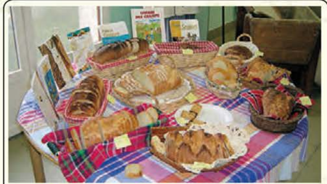
• Pains et farines.

L'exposition sera visible aux heures d'ouverture de la bibliothèque.