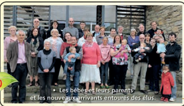
• Les bébés et leurs parents et les nouveaux arrivants entourés des élus.