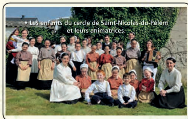
• Les enfants du cercle de Saint-Nicolas-du-Pélem et leurs animatrices.