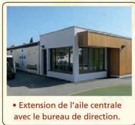
• Extension de l'aile centrale avec le bureau de direction.

En début de mandat, nous avons entrepris la mise en œuvre d'un projet de rénovation d'envergure au niveau de l'école. Après avoir réceptionné la fin des travaux de la première phase de cette rénovation, nous avons accueilli les enfants de maternelle dans de nouveaux locaux spacieux et bien aménagés pour la plus grande satisfaction des enseignants, des salariées de l'école, des parents.