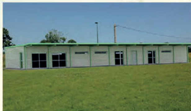
• Le projet de construction.

Le conseil municipal a délibéré sur cette acquisition le 19 août dernier en attribuant le marché à Module Création de Merdrignac. Le permis de construire, qui répond aux normes RT 2012, a été déposé en septembre et les travaux pourraient démarrer début 2014. Le montant du marché est de 280 001.54 € TTC financé de la manière suivante :