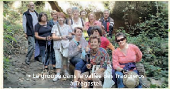
• Le groupe dans la vallée des Traouieres à Trégastel.

Les randonneurs impatients de se dégourdir les jambes ont ouvert leur saison le mardi 27 août à Plougrescant, journée pique-nique pour les uns et dimanche 1 er septembre à Trégastel pour les autres.