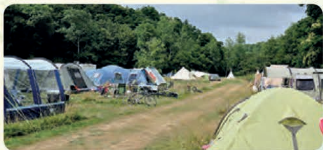
• Une vue du camping au plus fort de la saison.

Loïc FREMONT - Adjoint en charge du tourisme