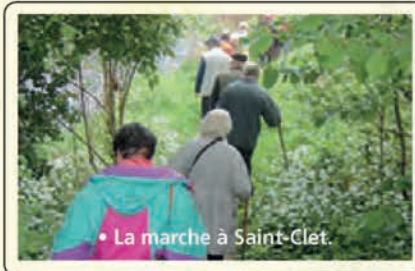
• La marche à Saint-Clet.

Le 16 mai : marche à Saint-Clet suivi d'un couscous à Trégonneau. Ce circuit, empruntant des chemins creux d'antan et des sentiers escarpés, offre des paysages variés; des secteurs boisés aux frondaisons denses, des zones humides et marécageuses, des parcelles cultivées pour découvrir, en fin de parcours, les méandres paisibles du Trieux.