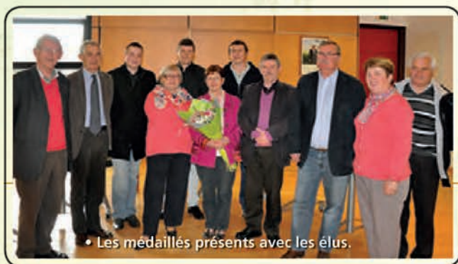
• Les médaillés présents avec les élus.