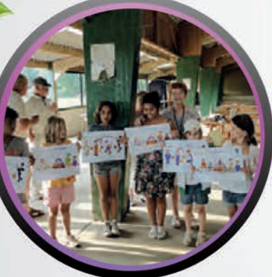
• La jeune génération présentant ses chefs-d'œuvre.